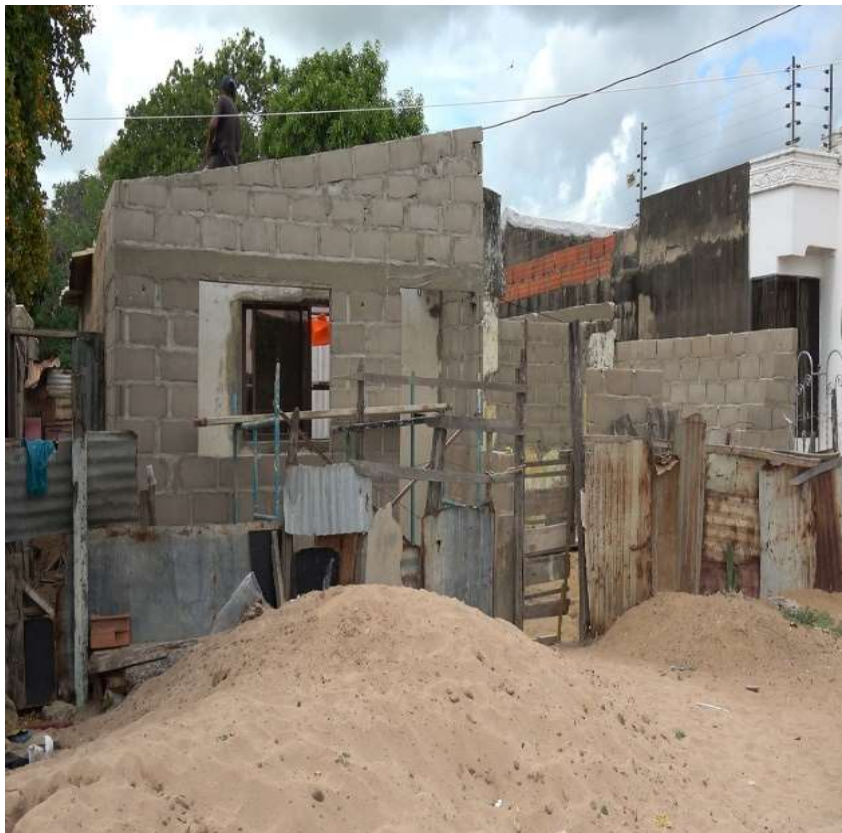
Habitación para pareja de ancianos de escasos recursos. 19 DE AGOSTO DE 2023.